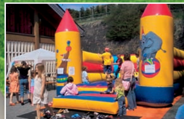
Hüpfburg für unsere kleinen Gäste