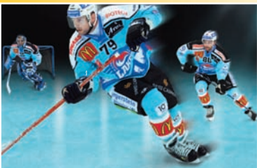
Autogrammstunde mit Cracks der Rapperswil-Jona Lakers Sonntag, 21. März, 11.30 bis 13.00 Uhr / 14.00 bis 15.30 Uhr