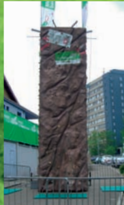
Kletterturm für das sportliche Kräftemessen